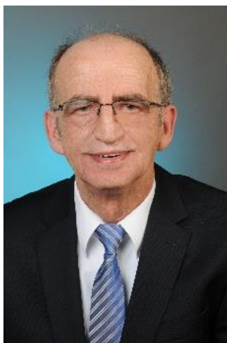
Unser Bürgermeister Eckhard Klodt (65)