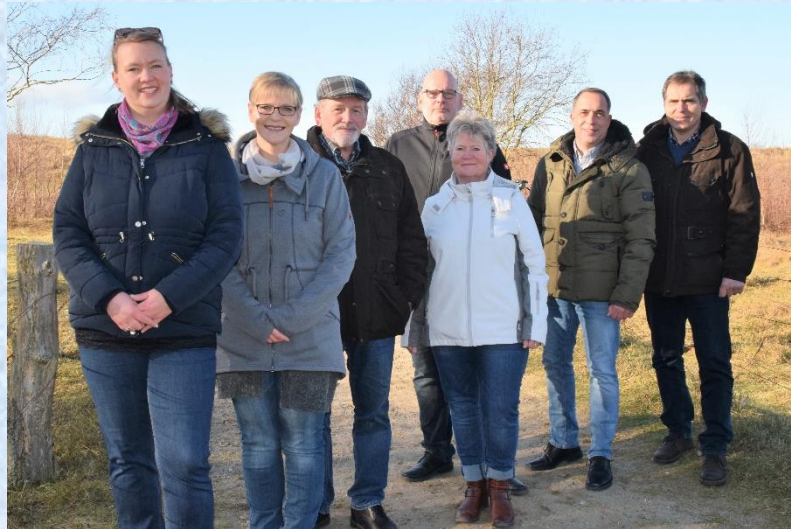
Unsere 7 Direktkandidaten

Gemeinsam... treten wir für transparente Gemeindepolitik mit den Bürger*innen ein.